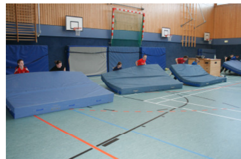
Mattenrutschen zum Austoben

Am Samstag ging es dann um 10.00 Uhr mit der Praxis wieder weiter. Für einige war selbst diese Zeit wohl noch zu früh, aber nach einem kurzen Spiel ging es dann richtig los. Heute stand auf dem Trainingsplan, Gewöhnung auf dem Tuch mit außergewöhnlichen Bewegungen. Mit den verschiedenen Kombinationen aus ganz leichten Übungsteilen wurde die Vielfalt der einzelnen Aktiven gefordert.