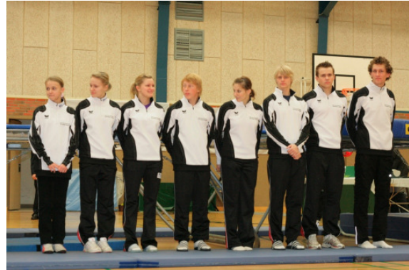
Ohne Chancen: Gut Heil Itzehoe mit 321,0