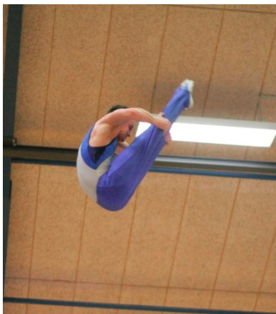
Perfektion im Triffis b .....

Am 15.11.2008 kam der Tabellenführer Bad Kreuznach zum Tabellenletzten Gut Heil Itzehoe nach Wacken. Die Gäste haben die lange Anfahrt diesmal mit dem Zug angetreten und mussten schon mitten in der Nacht raus. In Wacken ging es beim 3. und letzten Heimwettkampf für Itzehoe um 14.00 Uhr los. Gleich in der Pflicht konnten sich die Gäste mit guten Übungen schon absetzen und führten nach der Pflicht mit 101,6 zu 92,4 Punkten.