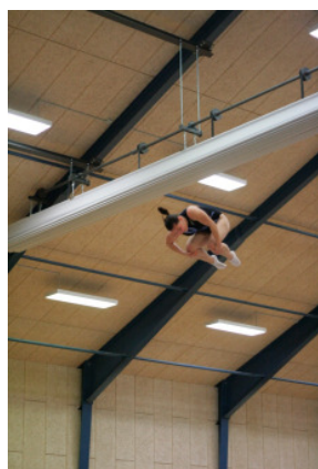
Triffis c von Jessica

Kreuznach gewinnt auch den letzten Durchgang klar mit 141,0 Punkten, so dass das Endergebnis 379,9 zu 321,0 für Kreuznach lautet.